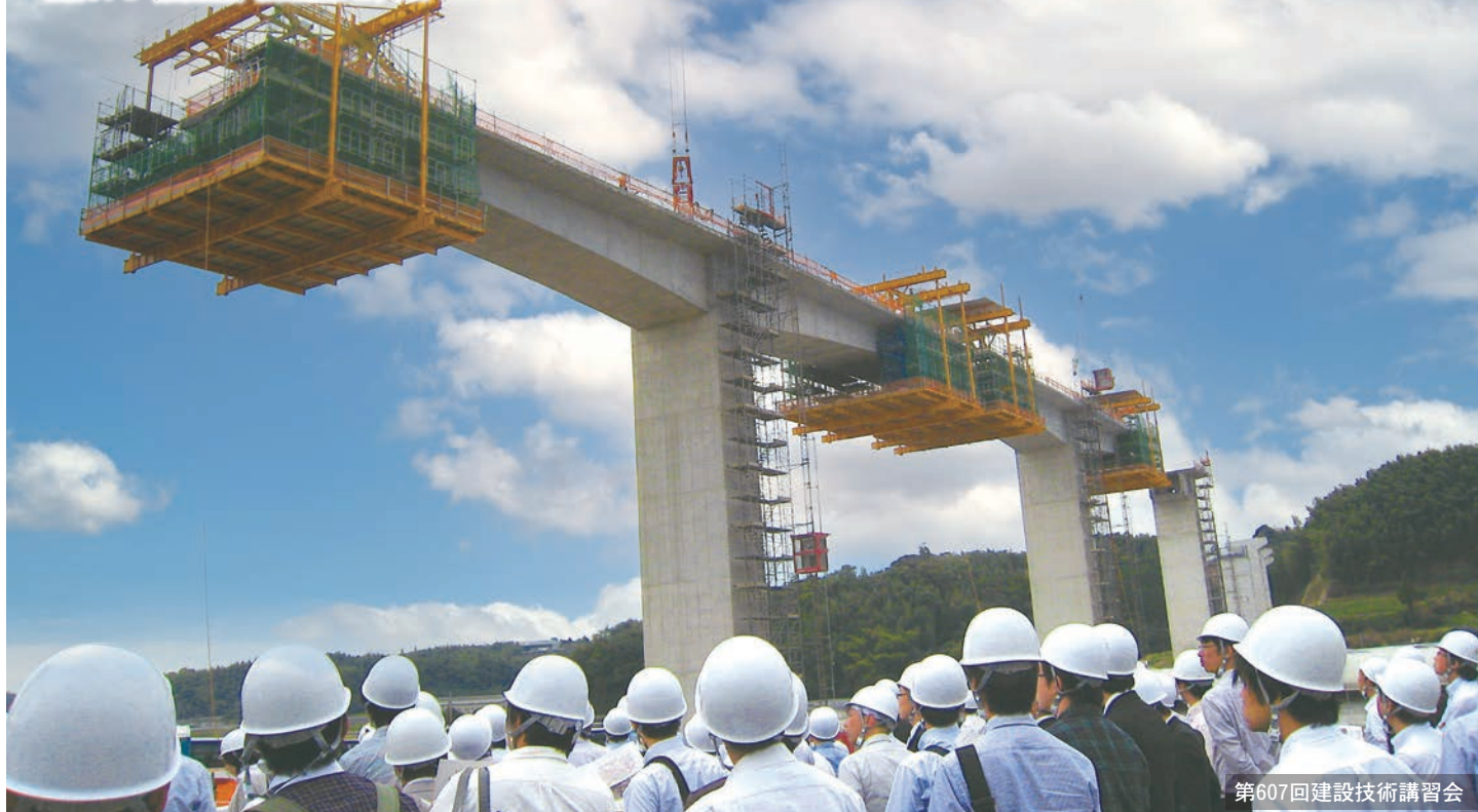
第607回建設技術講習会