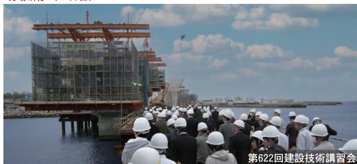
第622回建設技術講習会