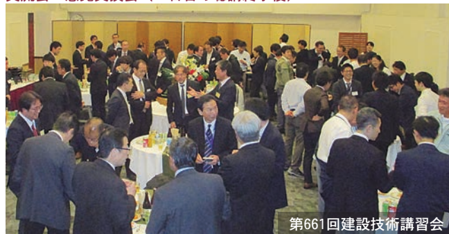
第661回建設技術講習会